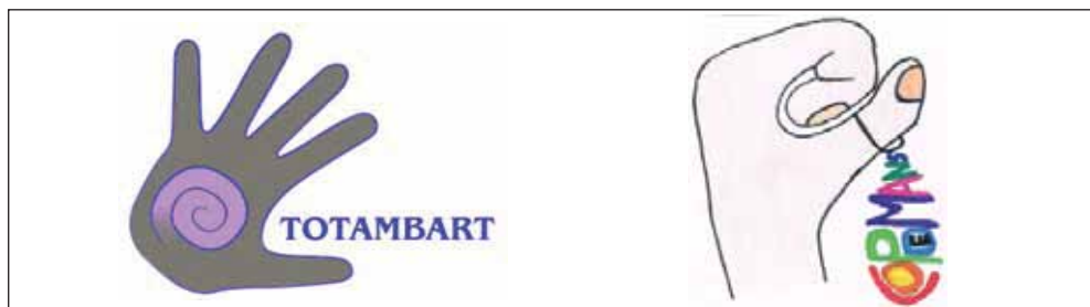
Imatge 2. Logos de les dues cooperatives creades: Totambart i Coopdemans

Va finalitzar amb la presència al BIZ Barcelona el 13 de juny i amb la justificació de comptes, l'avaluació i la realització d'una memòria i d'una activitat lúdica a final de curs.