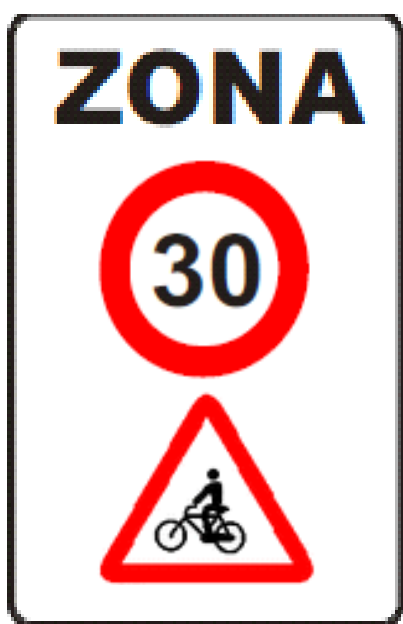
ENTRADA A LA ZONA

La senyalització que es pot trobar a una zona establerta com a Zona 30 és la següent: