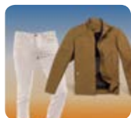
Jaqueta gruixuda de cotó i pantalons llargs tipus texà