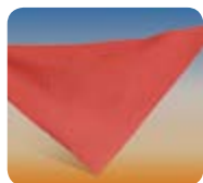
Mocador per al cap i el coll