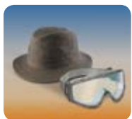
Barret i ulleres

En tots els casos, i per tant també si es produeix un accident, l'incompliment d'aquestes mesures de seguretat i recomanacions per als actes de foc serà responsabilitat de cada participant.