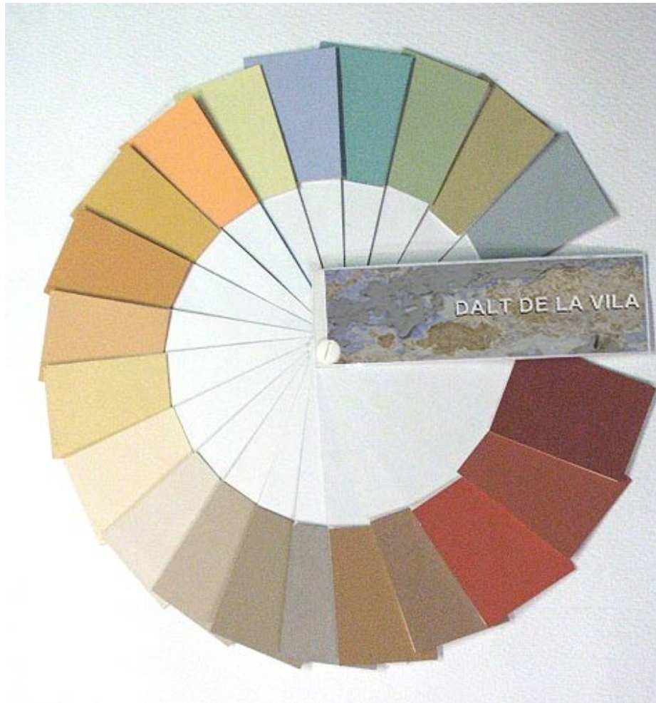
Paleta cromàtica mostrant els colors dels paraments.