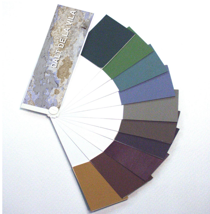
Patrons de la Carta de Colors per als elements de fusteria i serralleria.